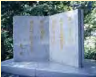
齋藤茂吉歌碑 “ほとほとにぬき温泉を浴むまも君が情を忘れておもへや”平成5年に齋藤茂吉の2番目の歌碑を古湯かじかの里公園に建立。