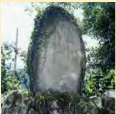
齋藤茂吉歌碑 “うつせみの病やしなふ寂しさは川上川のみなもとどころ”齋藤茂吉が病氣療養で古湯温泉に滞在した際、詠んだ38首の中の一つです。