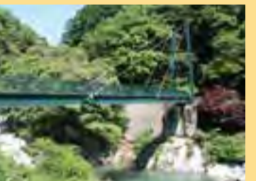
熊淵雌淵公園 森の深い緑とそこを流れる渓流、そしてダイナミックな岩々。夏は避暑に、秋には紅葉の景観が美しい自然名所です。