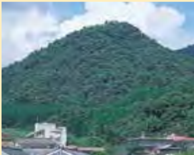
古湯城山公園 延元元年(1336年)に築城したと伝えられる古湯城。現在は自然石の碑、礎石が散在するこの地を整備し公園化しています。