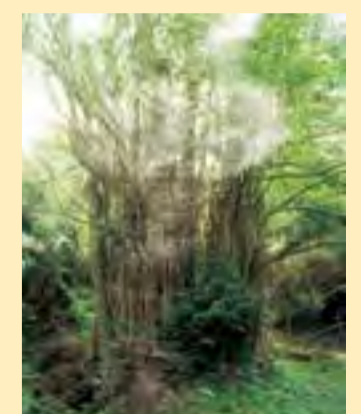
下合瀬の大カツラ 樹齢約1000年。樹高34m、根廻り20m、根張りの周囲37mあり、全国2位の大きさ。国の天然記念物に指定されています。