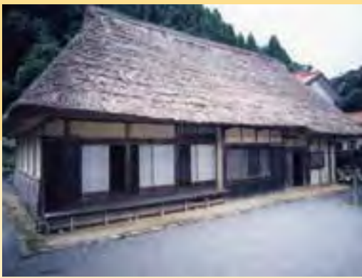
吉村家住宅 民家では県下最古の木造平屋建て萱葺き寄棟造りで、東側に土間、西側に5室がある、典型的な直家形式の農家です。