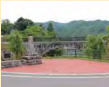
眼鏡橋 洪水にも耐えられる橋として、大正5年に架けられました。