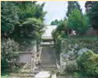
金福寺 明治の偉人江藤新平ちっ居の地。江藤はこの寺で、近隣の子供らに寺子屋を開き教えていたといわれています。