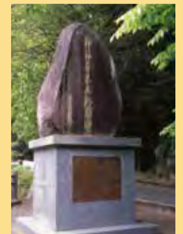
郭沫若記念碑 中国文学者で中国軽視にがまんできず妻子とともに古湯・熊の川温泉に投宿「行路難」等を文筆。古湯・熊の川温泉の中間地点に記念碑があります。